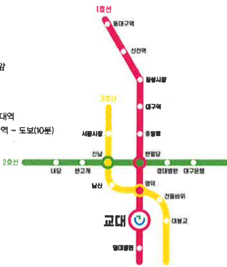
교대역 4번 출구에서 도보 5분 이내