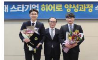
4기 히어로 수료식(2017.2.24) _