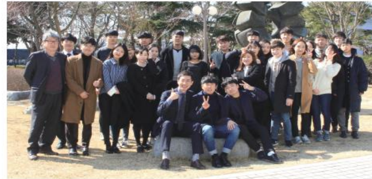
_4기 히어로 역행강화 캠프 in 경주(2017.2.25)_

기업에 취업하기 전 교육을 체계적으로 받을 수 있는 인큐베이터와 같은 사업!